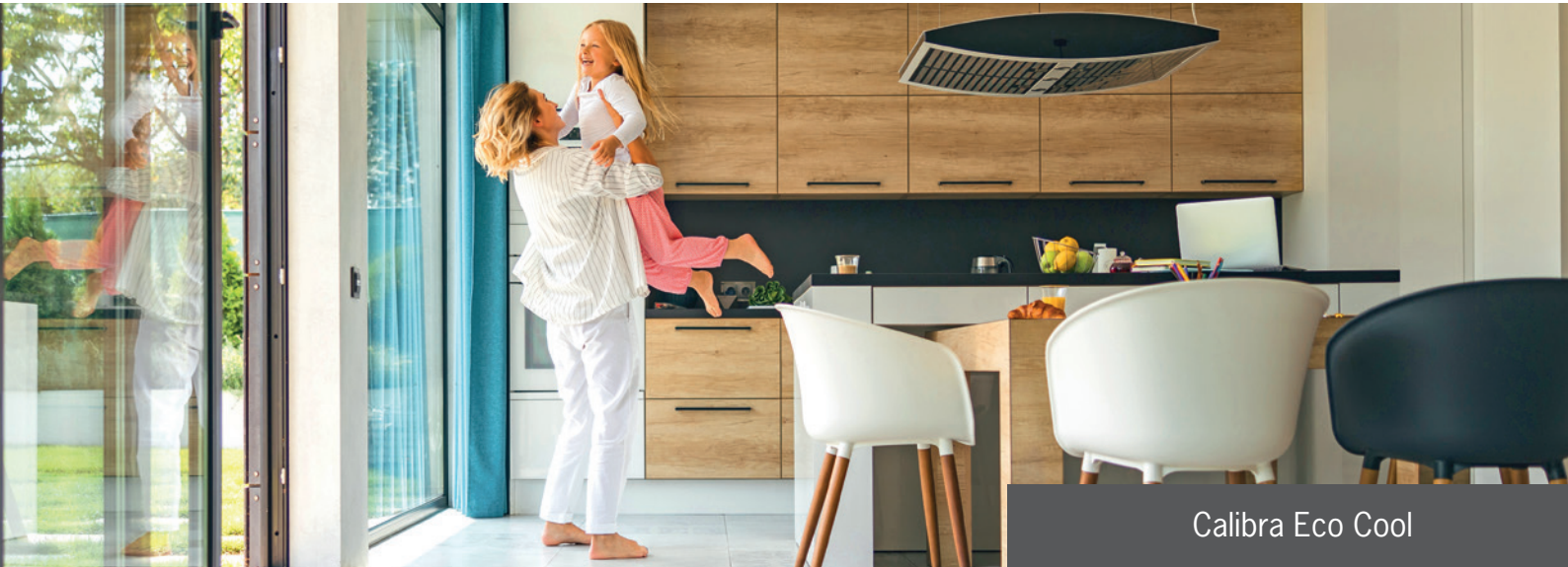
Calibra Eco Cool